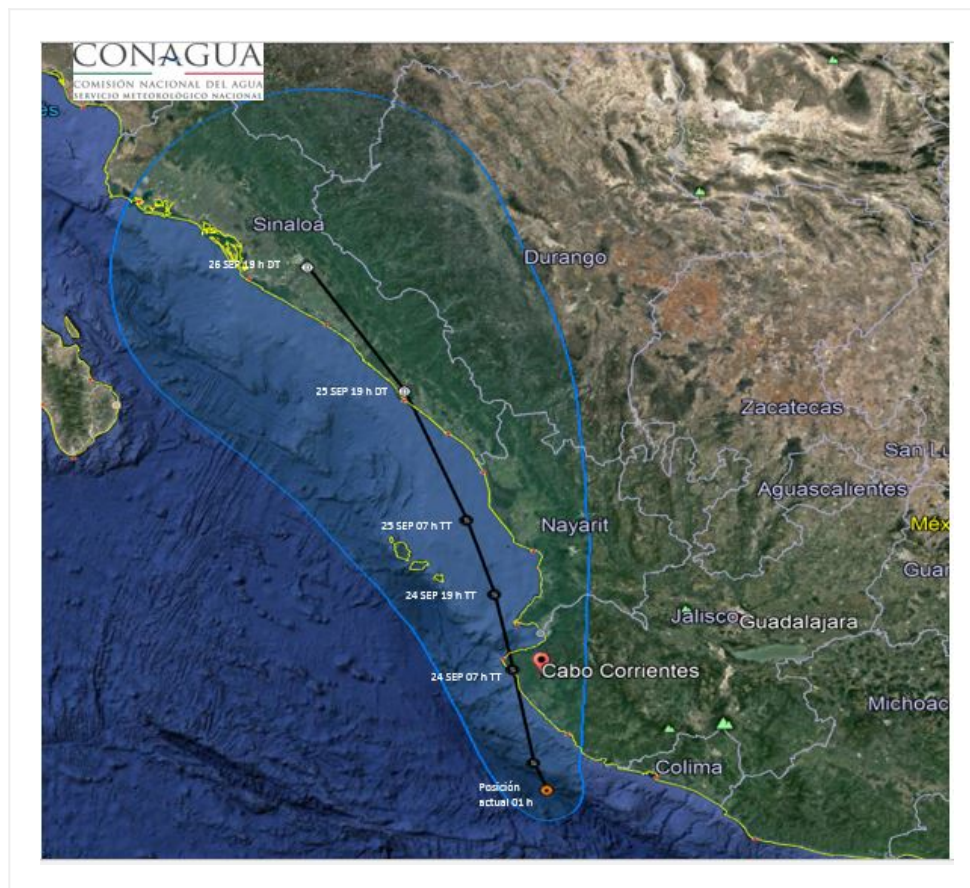
Trayectoria pronóstico de la tormenta tropical "Pilar"